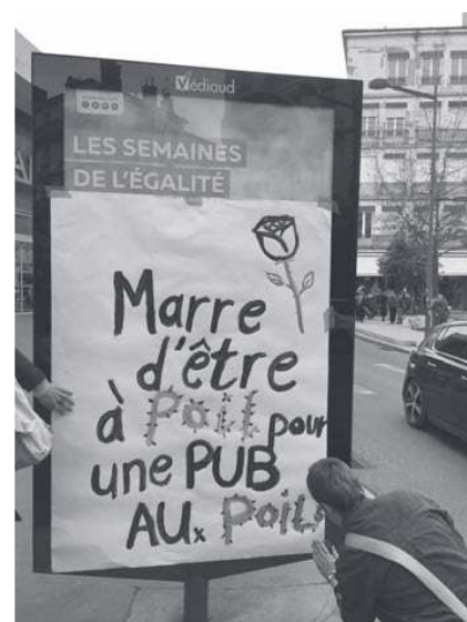
Recouvrement d'affiches sexistes. CNT Femmes Libres SaintÉ a répondu à l'appel des Sampianes et de la RAP (Résistance à l'agression publicitaire).