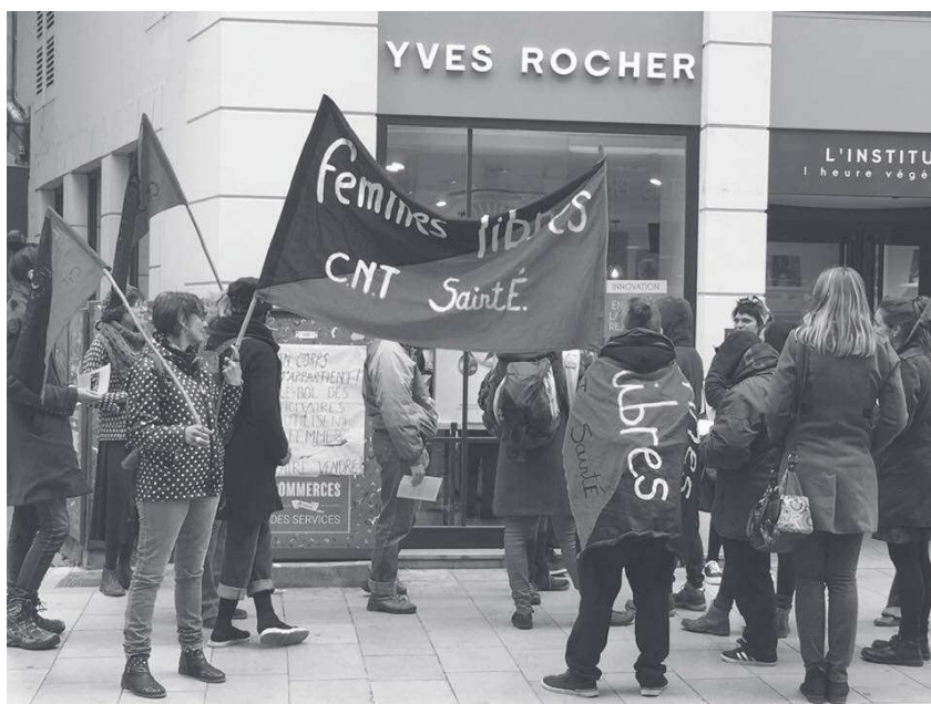
Action devant une boutique Yves Rocher en soutien aux ouvrières qui revendiquent leurs droits syndicaux dans son usine en Turquie.